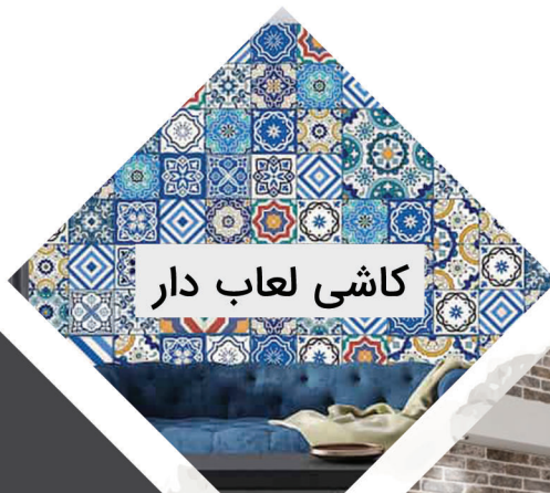
کاشی لعاب دار